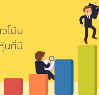
ตัวอย่าง Valuation เฉลี่ยของหลักทรัพย์ในกองทุน

ผู้จัดการกองทุนยังคงเพิ่มหาหลักทรัพย์ขนาดกลางและขนาดเล็กที่มีแนวโน้มเติบโตอย่างยั่งยืน ได้รับประโยชน์จากวัฏจักรเศรษฐกิจในช่วงเวลานั้นๆ และหุ้นที่มีปัจจัยบวกเฉพาะตัว โดยจะลงทุนในหลักทรัพย์ประมาณ 30+ หลักทรัพย์