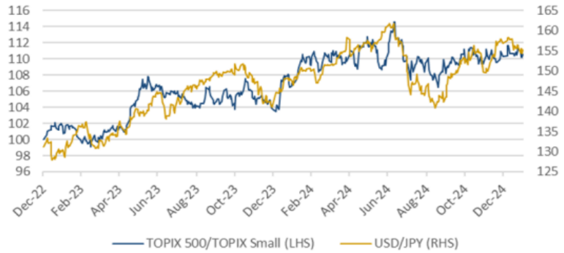
Relative price (TOPIX 500/TOPIX Small) and FX market (USD/JPY)

Note: Shunto data for 2025 is as of 17:00, 19 March.